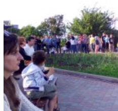
Фестивал ь уличной музыки в Полтаве. 2018