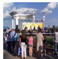
Фестивал ь уличной музыки в Полтаве. 2018

Зная, что сегодня у нас в городе проходит фестиваль уличной музыки, я разместил в Фэйсбуке пост с вопросом о том, что если есть кто сейчас рядом с Белой Беседкой, отзовитесь. Если там установлена сцена и идут концерты, стоит ли мне вообще сегодня выходить? Писали все что угодно, только не на мой прямой вопрос. Я решил испытать судьбу и выдвинулся посмотреть.