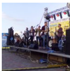
Slam- bang Band