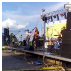
Ордер на арешт